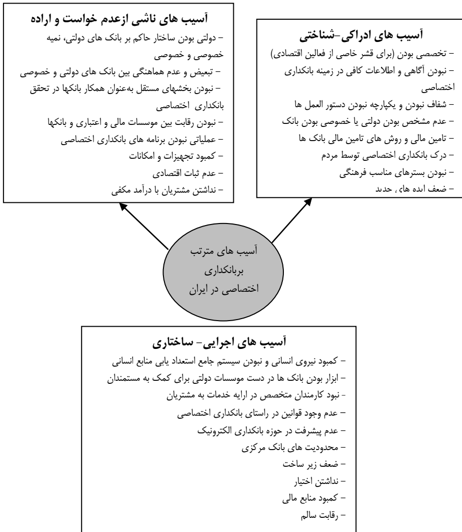
شکل شماره (۳) چالش‌های صنعت بانکداری اختصاصی در ایران

در شکل (۳) زیر مهمترین چالش‌های صنعت بانکداری اختصاصی در ایران از نگاه شفيعی رودپشتی و همکاران (۱۳۹۳) آمده است: