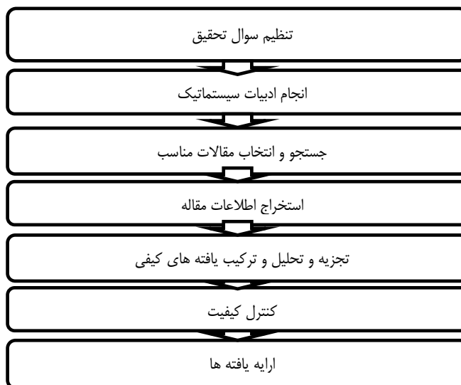
شکل شماره (۱) مراحل روش فراترکیب