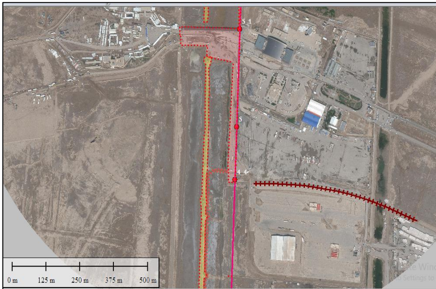
نقشه شماره (۶) تصویر ماهواره‌ای از موقعیت شبکه ریلی خرمشهر به شلمچه

ساخت محور ریلی شلمچه-بصره طی ۲ تفاهم‌نامه در سال‌های ۱۳۹۰ و ۱۳۹۳ بین کشور ایران و عراق مطرح شد. بر اساس این تفاهم‌نامه مقرر شد کشور ایران نسبت به ساخت پل بر اروند اقدام کند. طرف عراقی درخواست ساخت پل باز شو جهت عبور شناورها را ارائه کرد. این پیشنهاد با شرط پرداخت هزینه اضافی از سوی عراق مورد موافقت قرار گرفت. از طرف دیگر عراق متعهد شد تا پس از انجام عملیات مین‌روبی و تملک اراضی، نسبت به ساخت ۳۲ کیلومتر خط آهن از بصره تا مرز شلمچه اقدام کند (نقشه شماره ۶). بعد از کنگ‌زنی پروژه در سال ۱۳۹۴؛ در بودجه سال ۱۳۹۵ مبلغ ۱۵۰ میلیارد تومان برای احداث آن پیش بینی شد اما به دلیل آنکه طرف عراقی نسبت به انجام تعهدات خود اقدام عملی انجام نداد، ساخت و اجرای این پل از سمت ایران نیز به حالت تعلیق درآمد. وضعیت نابسامان اقتصادی عراق و فشارهای آمریکا از موانع عمده اجرا و تکمیل این پروژه مهم است.