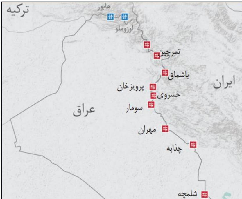
نقشه شماره (۴) موقعیت گذرگاه‌های مرزی ج.ا.ایران با عراق در طول نوار مرز

مطابق نقشه شماره (۴) در طول ۱۶۰۰ کیلومتر مرز مشترک ایران و عراق ۹ گذرگاه زمینی در پنج استان آذربایجان غربی، کردستان، کرمانشاه، ایلام و خوزستان قرار دارند. [تمرچین (حاجی عمران)، سیران‌بند (اقلیم کردستان عراق)، باشماق (اقلیم کردستان عراق)، پرویزخان (اقلیم کردستان عراق)، خسروی (منذریه)، سومار (مندلی)، مهران (زرباطیه)، جذابه (الشیب) و شلمچه].