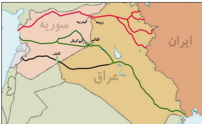
نقشه شماره (۷) موقعیت شبکه‌های ارتباطی موجود بین عراق و سوریه

مطابق نقشه شماره (۷) ایران در حال حاضر سه کریدور زمینی از طریق عراق به سمت سوریه و دریای مدیترانه ساخته است. مسیر اول (مسیر اول) کریدور شمالی است که از سنجار گذشته و به ربیعه در مرز سوریه می‌رسد؛ مسیر دوم) از جنوب به شمال در امتداد فرات گسترش پیدا کرده و بعد از بغداد به سمت غرب رفته و بعد از عبور از صحرای الرمادی در سوریه به شهر مرزی القائم می‌رسد؛ و مسیر سوم) از طریق منطقه بین گذرگاه مرزی الولید عراق و منطقه التنف سوریه امتداد دارد. این مسیر کوتاه‌ترین مسیر از بغداد به دمشق در نظر گرفته می‌شود، اگرچه مستقیماً از التنف، منطقه استراتژیک تحت کنترل نیروهای آمریکایی در غرب مرز سوریه و عراق می‌گذرد. ایران نیز در تلاش است تا از این مسیر برای دستیابی به یک ارتباط موثر جغرافیایی با حزب الله لبنان بهره برداری کند.