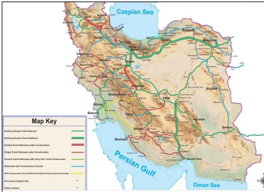
نقشه شماره (۱) موقعیت شبکه ریلی ج.ا.ایران در سال ۱۴۰۰