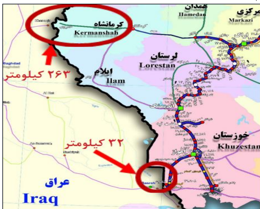
نقشه شماره (۵) موقعیت راه آهن غرب و جنوب غرب ایران نسبت به شبکه ریلی عراق

طرح اتصال راه آهن خرمشهر به شلمچه (به طول ۱۷ کیلومتر) در سال ۱۳۹۰ به بهره‌برداری رسید و ادامه آن تا شهر بصره به طول ۳۲ کیلومتر در خاک عراق باقی مانده است. در حال حاضر خط ریلی از بصره تا کربلا فعال است، به نحوی که زائرین ایرانی خود را با قطار به مرز شلمچه رسانده و پس از پیمودن مسیر ۳۲ کیلومتری تا راه آهن بصره با اتوبوس، مجدداً با قطار عراقی به سمت کربلا راهی می‌شوند. به این ترتیب با تکمیل خط ریلی بین شلمچه تا بصره اتصال ایران از طریق خرمشهر به عراق و کشورهای شرق مدیترانه بدون انقطاع برقرار می‌شود و تحویلی بزرگ در زمینه ترانزیت و تبادل کالا و مسافر صورت خواهد پذیرفت (نقشه شماره ۵).